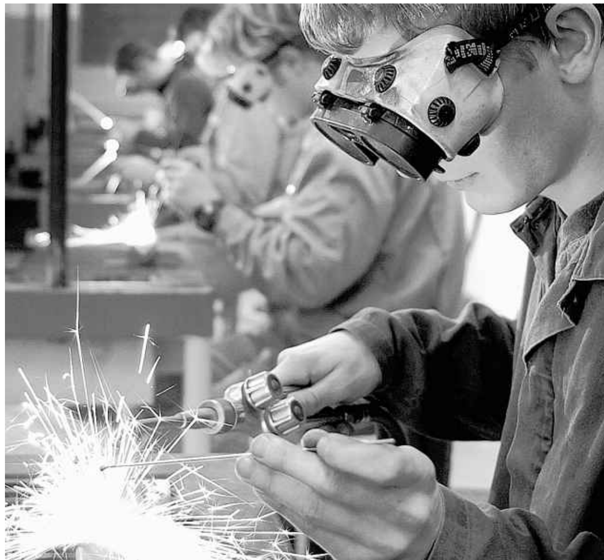
Schweißerlehrgänge werden bei den Weiterbeeildungseinrichtungen zurzeit besonders oft nachgefragt

Während die Arbeitsagentur die Weiterbildung für gering qualifizierte über so genannte Bildungs-